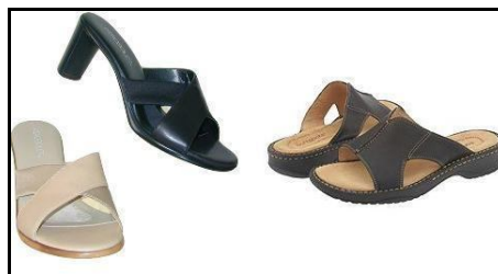
Лечебные (ортопедические) сандалии