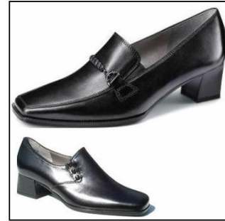
Туфли на широком и низком каблуке